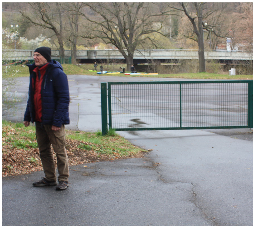
Da hat doch jemand den Schlüssel vergessen

Für eingesandte Manuskripte und Bilder wird keine Haftung übernommen. Die Redaktion behält sich Kürzung und sinn- wahrende Änderungen vor. Weiterverwendungen, auch auszugsweise, sind nur nach vorheriger Zustimmung der Redaktion zulässig. Die mit Namen oder Initialen gekenn- zeichneten Texte geben nicht zwangsweise die Meinung des Sächsischen Kanu-Ver- bandes bzw. der Redaktion wieder.